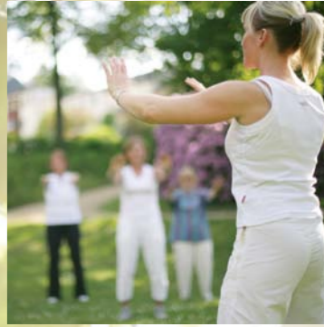
Sie haben die Möglichkeiten, im hauseigenen Schwimmbad Aquafitnesskurse zu besuchen oder sich beim Yoga zu entspannen.

All unsere Angebote vermitteln Ihnen in verständlicher Weise wichtiges Grundlagenwissen zu gesundheitspädagogischen Themen und unterstützen Sie bei einer nachhaltigen Optimierung Ihres persönlichen Gesundheitsverhaltens.