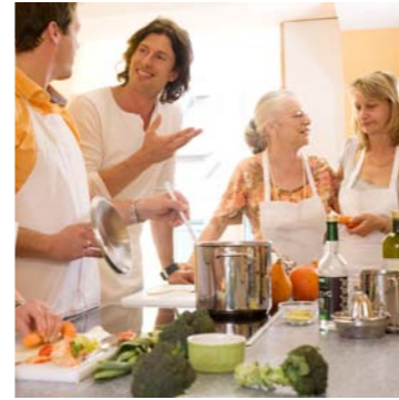
Genießen Sie unsere gesunde Küche bei den gemeinsamen Mahlzeiten.